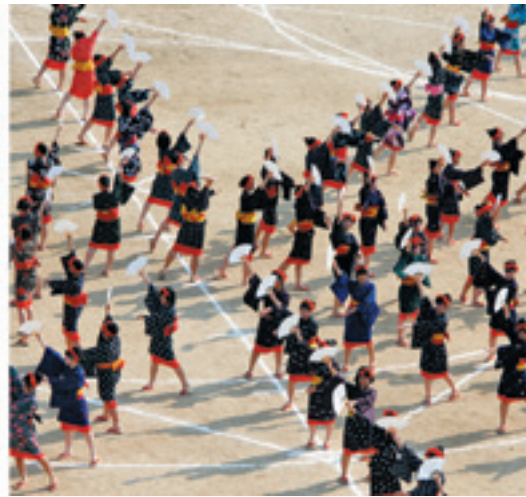
伝統のデカンショ／民謡踊り 第68回観一祭にて（平成28年9月10日）