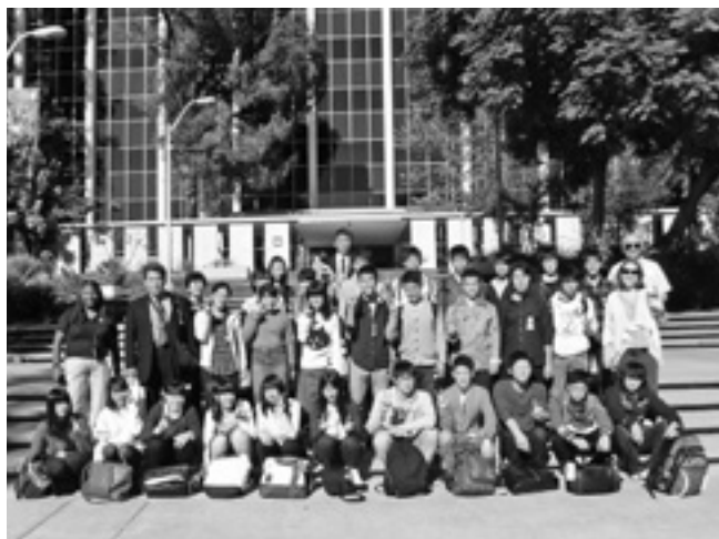
SSH海外科学体験研修 NASAジェット推進研究所(JPL) 2015年11月19日