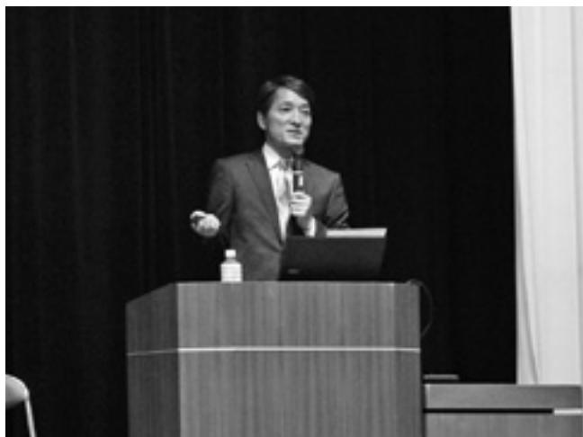
生徒教養講座 NHKニュースウオッチキャスター 河野憲治氏(観一昭56年卒)講演 演題「伝える仕事」 2016年4月24日