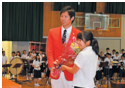
2016年7月28日 荻田大樹選手オリンピック出場壮行式