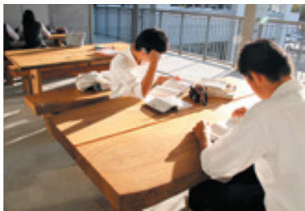
同窓会寄贈の 樟のテーブルとイス